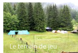
Le terrain de jeu